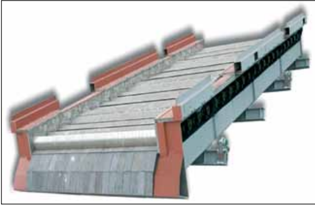
Górna część rusztu: Ruszt w instalacji termicznego przetwarzania odpadów TAS w miejscowości Kolding