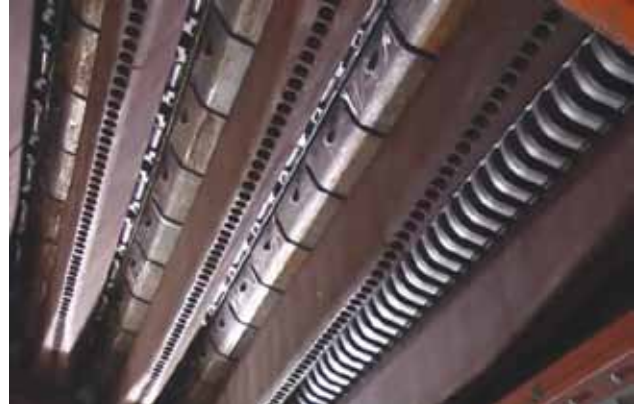
Spód rusztu: brak elastycznych przewodów pod rusztem